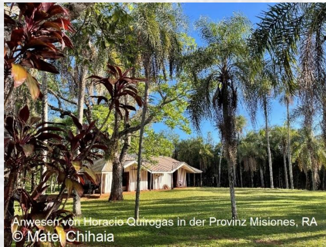
Anwesen von Horacio Quiroga in der Provinz Misiones, RA

Der uruguayische Schriftsteller Horacio Quiroga lebte in der Waldregion von Misiones zwischen Argentinien, Brasilien und Paraguay. Angesichts der menschlichen Grausamkeit und der Massenvernichtung des Ersten Weltkriegs wirft er in seinen Erzählungen die Frage auf: sollten wir uns nicht an den Tieren des Urwalds ein Beispiel nehmen? Diese provokative Sicht auf Gesellschaft vom Standpunkt vermeintlicher Wildnis hat seit einem Jahrhundert nichts an Aktualität verloren. Die in ganz Lateinamerika gelesenen Geschichten Quirogas haben besondere Relevanz für das Zeitalter des Anthropozäns.